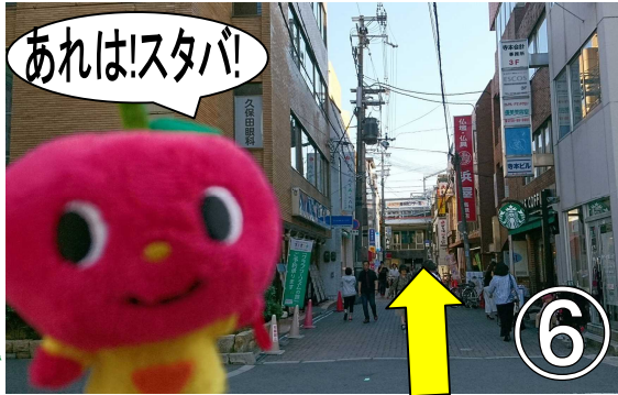
④スタバが見えてきます。車に気をつけて横断ください。