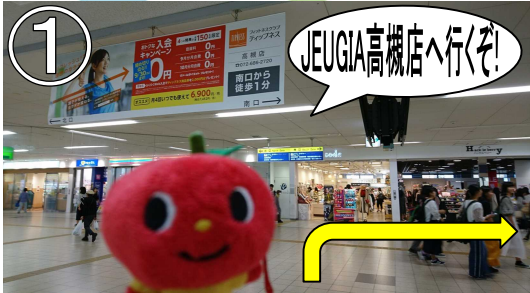
①JR高槻駅の改札を出たら右に進む。