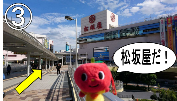
③すぐに松坂屋が見えるのでそのまま直進してください。