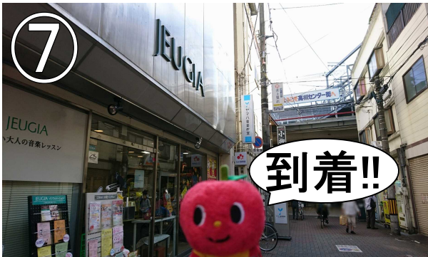
⑦スタバを超えればすぐそこ左手に現れます。