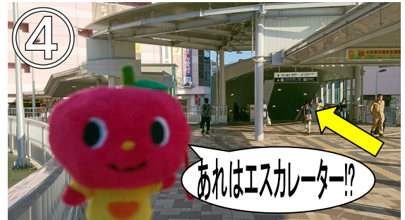
⑥直線に歩いていくとエスカレーターが見えるので降りましょう。