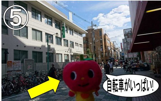
⑤エスカレーターを下り、松坂屋を右手にまっすぐ進みます。