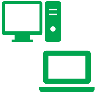
デスクトップパソコン ノートパソコン

■オンライン商談は「zoom」を使用致します。事前に「zoom」ができる環境をご用意下さい。