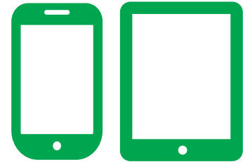
スマートフォン・タブレット