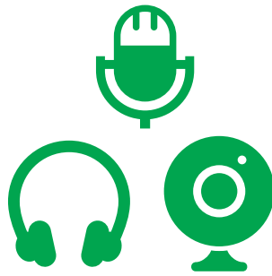
マイク・WEBカメラ スピーカー（ヘッドホン）